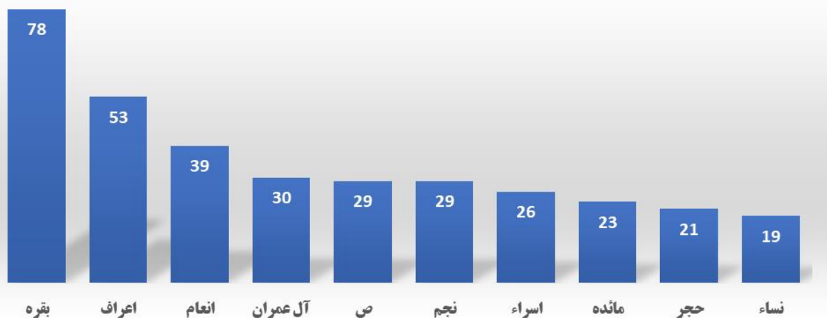
نمودار ۲- بیشترین کاربرد آیات بر اساس سوره‌های قرآن در مرصادالعباد