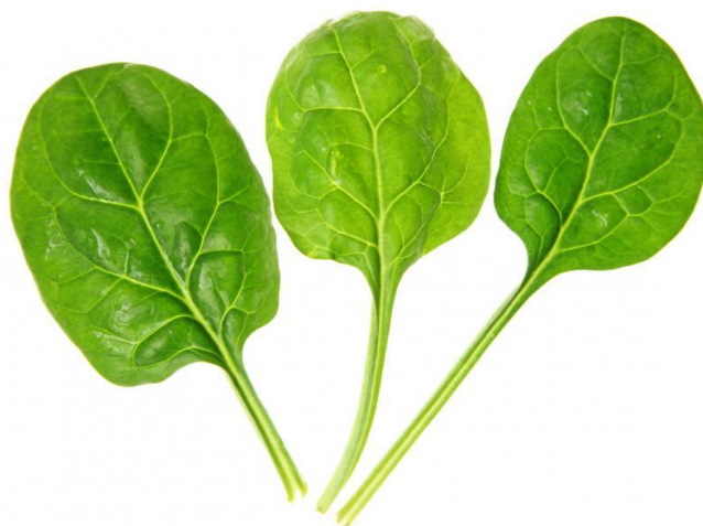
شکل شماره ۱. برگ اسفناج