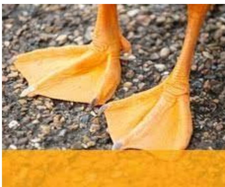
شکل شماره ۳. پای بط

از انواع دیگر پیکان‌های ذکر شده در آداب‌الحرب، «بط پای» است: «تیر خفتان و بغلتاق و برگستوان جامگی را پیکان... بط پای باید.» (فخر مدبر، همان: ۲۴۲) بط پای پیکانی است که به قیاس پیکان ماهی پشت، از شکل ظاهری پای مرغابی برگرفته شده است. پای بط پهن است و این حیوان از این پهنای برای بهتر شنا کردن استفاده می‌کند: «چون اسب را به دریا رانند کاسه‌سم بهتر شنا کند؛ زیرا که در شناوری دست و پای کاسه‌سم حکم پای بط و غاز دارد و پهن است.» (میرآخور، ۱۳۸۷: ۳۴۸)؛ «پای لشکریان در موزه به سان پای بط در بحر محیط شناور شد.» (میرخواند، ۱۳۳۹، ج ۶: ۳۲)؛ بنابراین با توجه به این شواهد، به یقین می‌توان گفت که پیکان بط پای نوعی پیکان پهن بوده که شبیه پای بط بوده است.